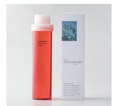
バランススキンローション ¥5,720 (税込) ゆらぎ肌向け