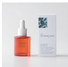
ブースターオイル ¥6,380 (税込) 乾燥肌向け