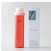
エイジングケア※1 ローション ¥6,160 (税込) 乾燥肌向け