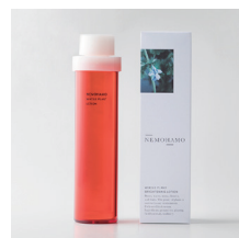
ブライトニング※2 ローション ¥5,940 (税込) くすみ※3対策