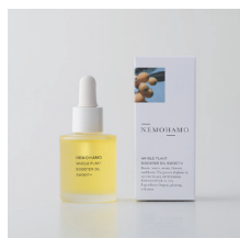
ブースターオイルス ムース ¥6,380 (税込) 敏感肌向け