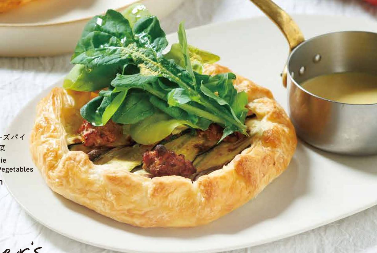
▼ ファーマーズパイ 季節の野菜 Farmer's Pie Seasonal Vegetables 2,400yen