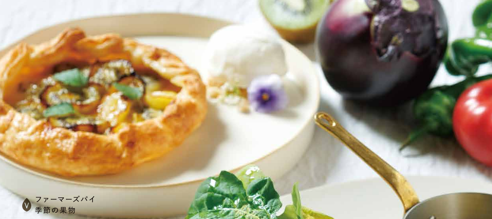
▼ ファーマーズパイ 季節の果物 Farmer's Pie Seasonal Fruits 2,400yen