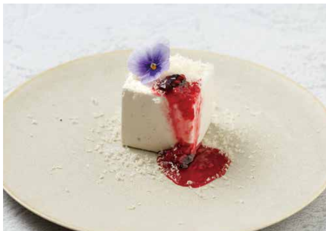
🍷 チーズケーキ Cheese Cake 950yen