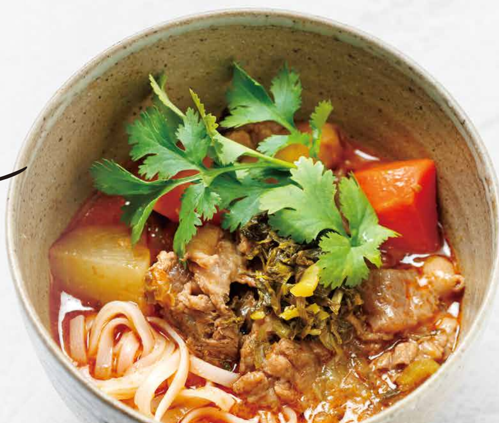
牛肉トマト麺 Beef Tomato Rice Noodles 1,800yen