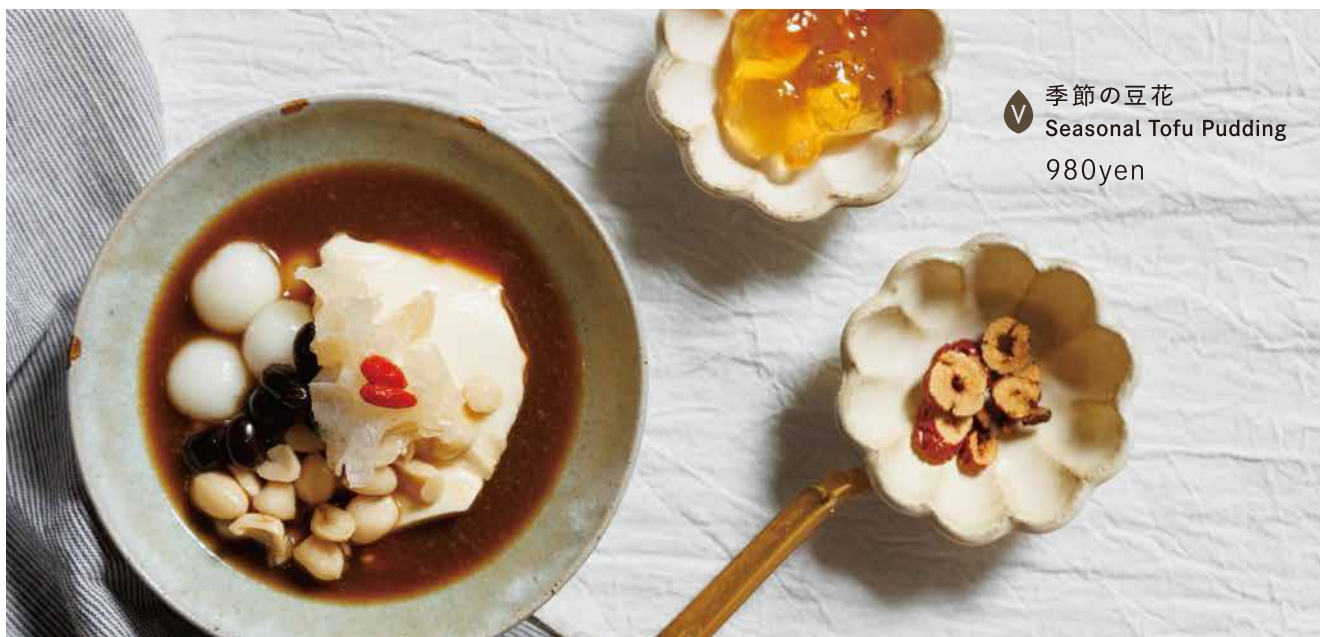
🍷 季節の豆花 Seasonal Tofu Pudding 980yen