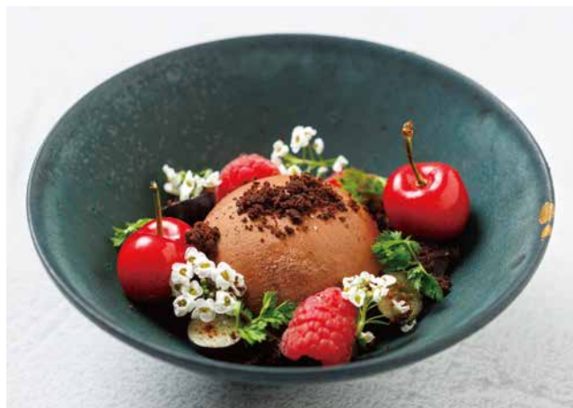
🍷 チョコレートケーキ Chocolate Cake 950yen

価格はサービス料10%と税金を含みます。 All prices include a 10% service charge and tax.