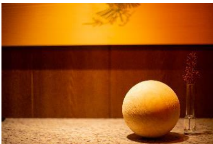
森のなかにいるような優しい香りのひのき玉