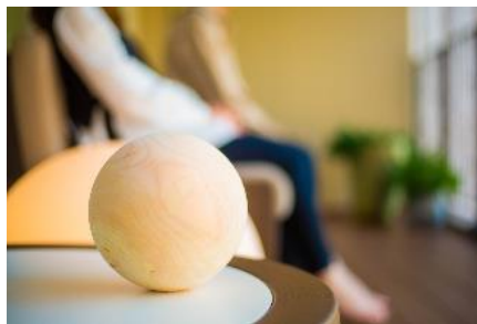
室内のインテリアにも自然な風合い