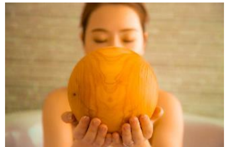
お風呂で檜風呂の気分で楽しむことも