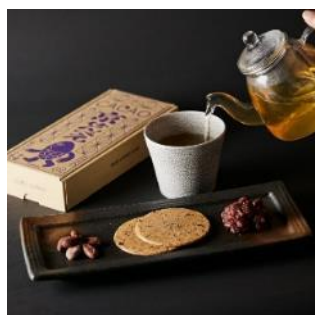
カカオ京せんべえ