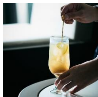
カカオジンジャーレモン