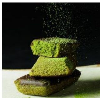
日本茶に合う京都抹茶フィナンシェ