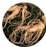
オタネニンジン 保湿成分