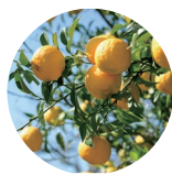
ユズ 基剤・ エモリエント成分