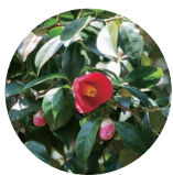
ツバキ 基剤・ エモリエント成分