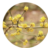
クロモジ 天然精油 (賦香成分)