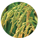
コメヌカ 基剤・ エモリエント成分