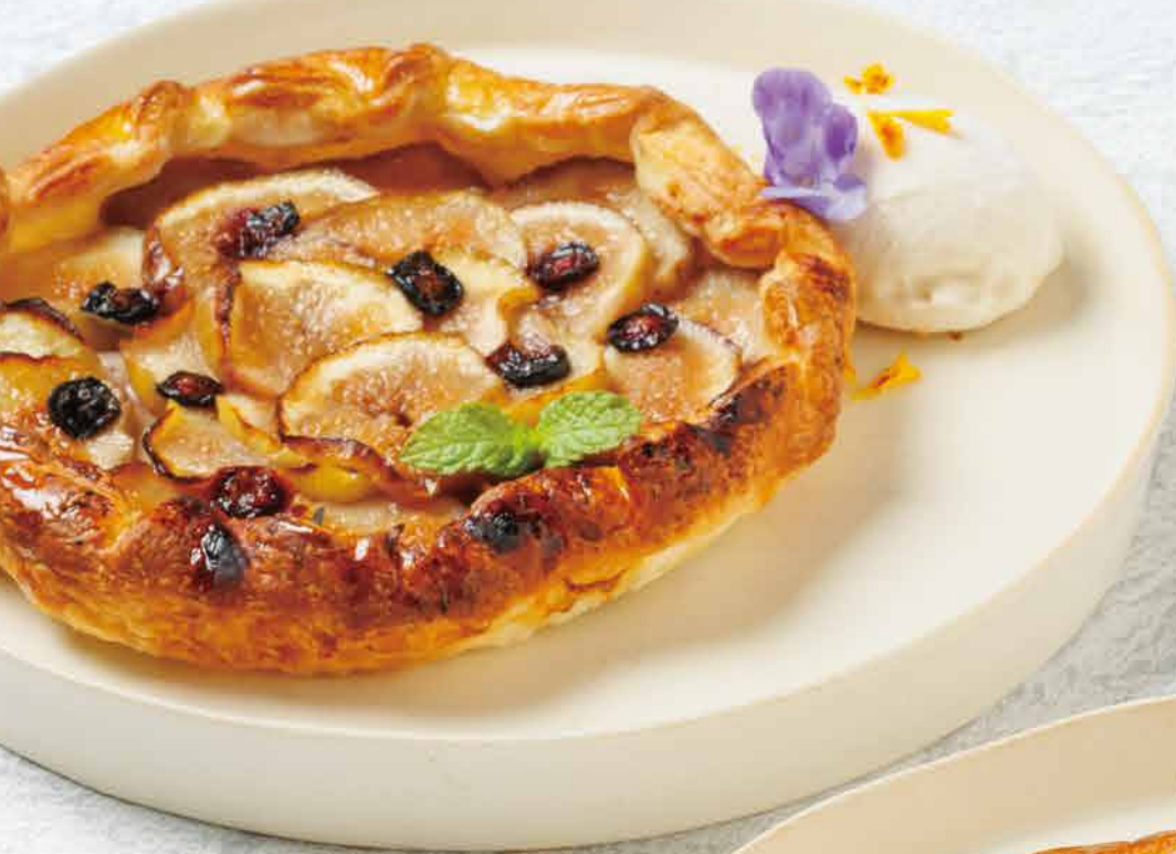
▼ ファーマーズパイ 季節のフルーツ/無花果 Farmer's Pie / Fig 2,400yen