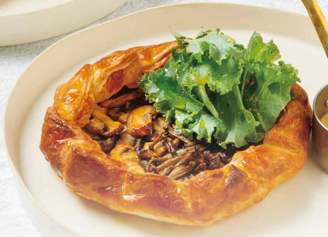
▼ ファーマーズパイ 季節の野菜 Farmer's Pie Seasonal Vegetables 2,400yen