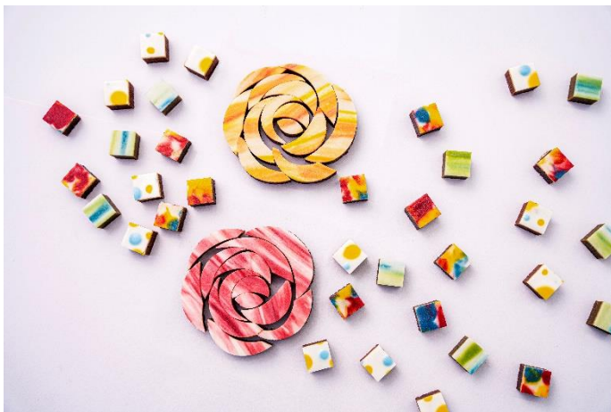
プラントベースのオリジナルチョコレート