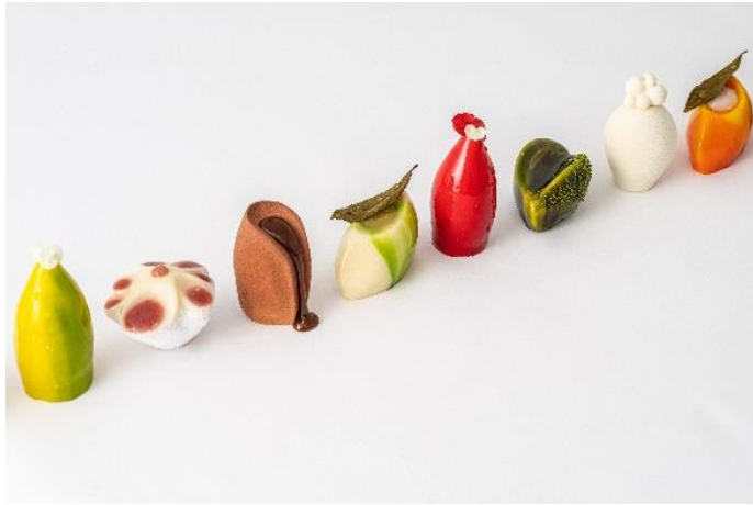
3階のカフェでお召し上がりいただけるデザート