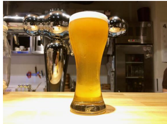
一乗寺ブリュワリー