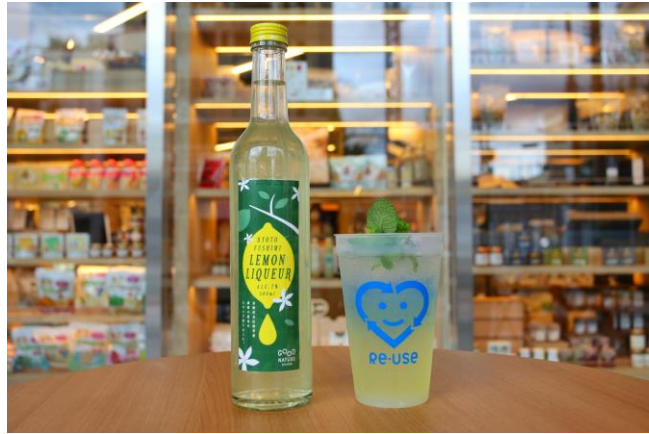
京都伏見レモンリキュール (左) /レモンサワー(右)

期間中は当施設 1 階の MARKET KITCHEN オリジナルレモンリキュールのボトルとレモンサワーを販売いたします。原料は伏見区にて農薬不使用で育てられたレモンに、アガベシロップを使用。美味しく、地球環境にも優しいオリジナルのドリンクを提供いたします。