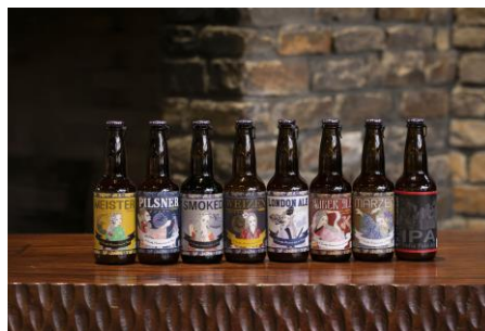
丹後王国ブルワリー

※都合により一部内容・営業時間を変更する場合がございます。最新の情報は GOOD NATURE STATION 公式ホームページ( https://goodnaturestation.com/ )でご案内いたします