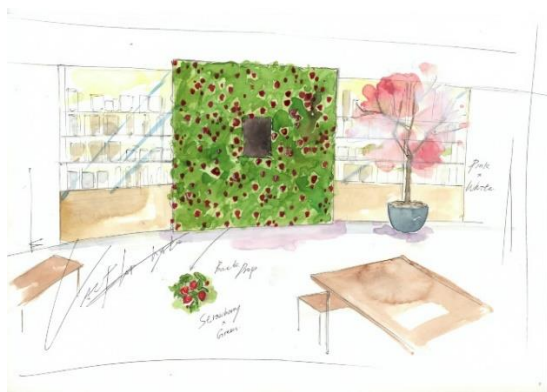
1階 MAENIWA 装飾イメージ

日本の春を告げる花といえば“桜”。心地よい桜色の空間の中で、優しい春を感じていただきたい想いでデザインしました。お客様をお迎えする1階 MAENIWA では、桜を模した植木と、たっぷりのいちごの実をあしらったグリーンウォールを設置。4階 GALLERY では、スモークツリーやカスミソウを吊り下げた頭上に咲く花畑を装飾。ドライフラワーでアートに彩った鏡とあわせてお楽しみいただけます。