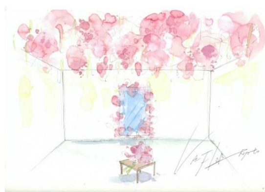
4階 GALLERY 装飾イメージ

期間： 3月20日(土)～4月18日(日) ※GALLERYは5月5日(水)まで 場所： 1階 「MAENIWA」、4階 「GALLERY」