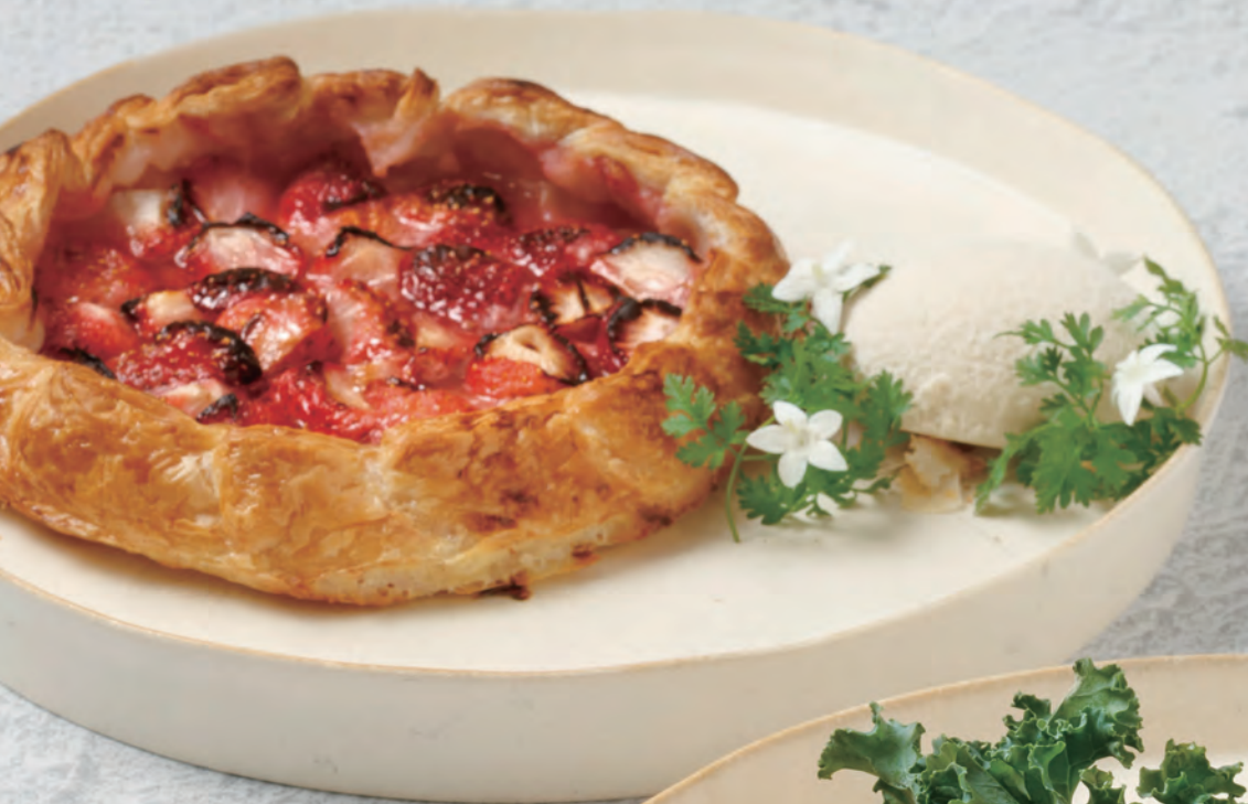
V ファーマーズパイ 季節のフルーツ/いちご Farmer's Pie / Strawberry 2,400yen