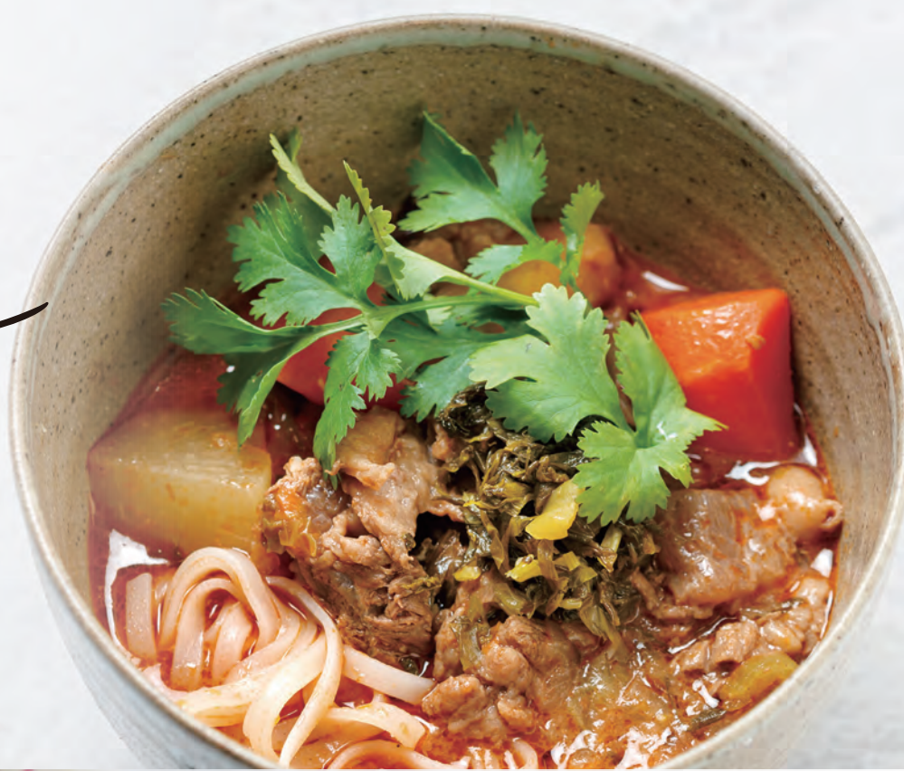
牛肉トマト麺 Beef Tomato Rice Noodles 1,800yen