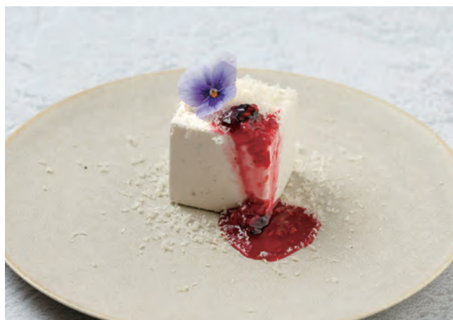
🍷 チーズケーキ Cheese Cake 950yen