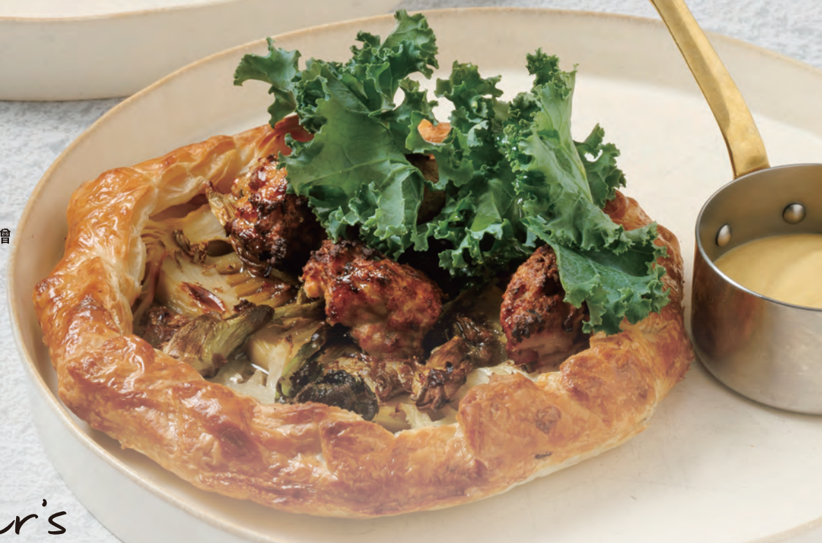
V ファーマーズパイ 季節の野菜/山菜 落の臺味噌 Farmer's Pie Wild Vegetables 2,400yen