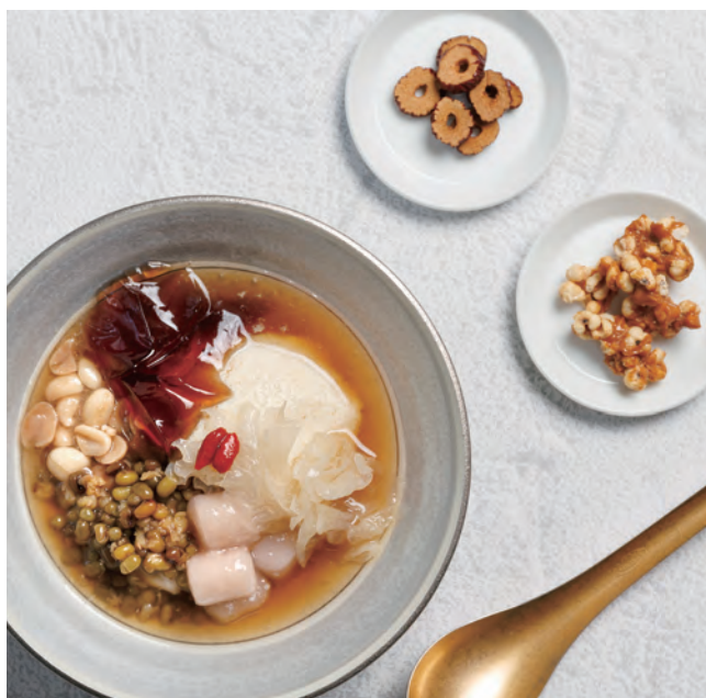
🍷 季節の豆花 中国/四川産 ジャスミンシロップ 980yen Seasonal Tofu Pudding Jasmine Tea Syrup