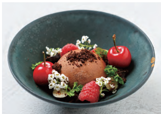
🍷 チョコレートケーキ Chocolate Cake 950yen

価格はサービス料10%と税金を含みます。 All prices include a 10% service charge and tax.