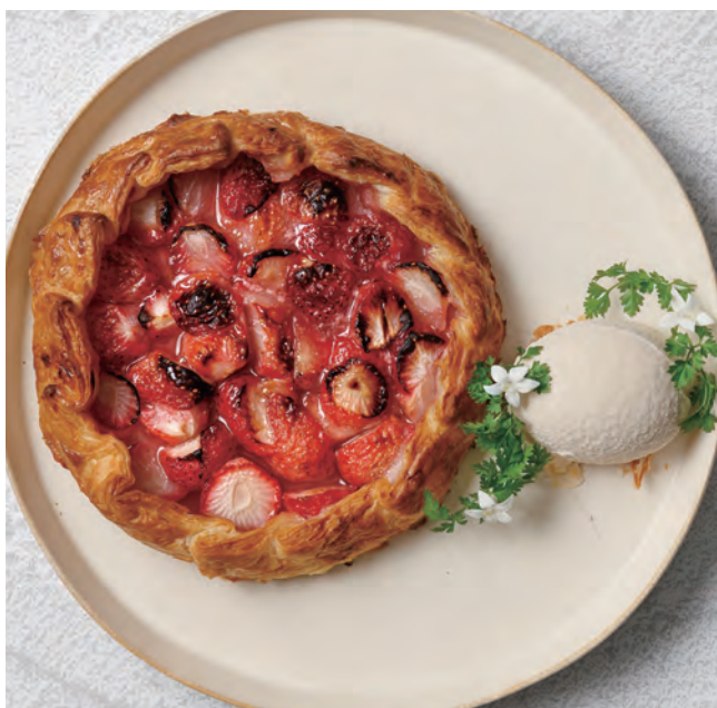
🍷 ファーマーズパイ 季節のフルーツ/いちご Farmer's Pie / Strawberry 2,400yen